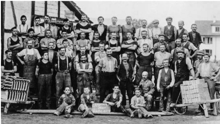
Die Belegschaft der Ziegelei Horw im Jahre 1924.