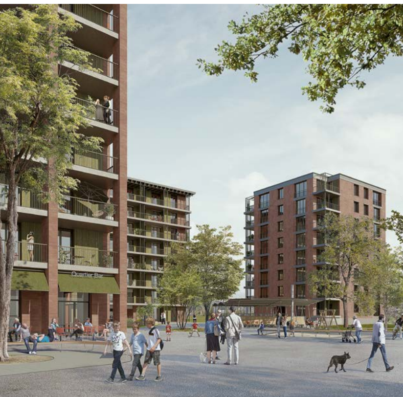
Auf dem Areal der Ziegelei in Horw entsteht derzeit ein qualitativvolles Wohnquartier mit 107 Mietwohnungen. Verbaut werden dabei Back- und Dämmsteine von AGZ.