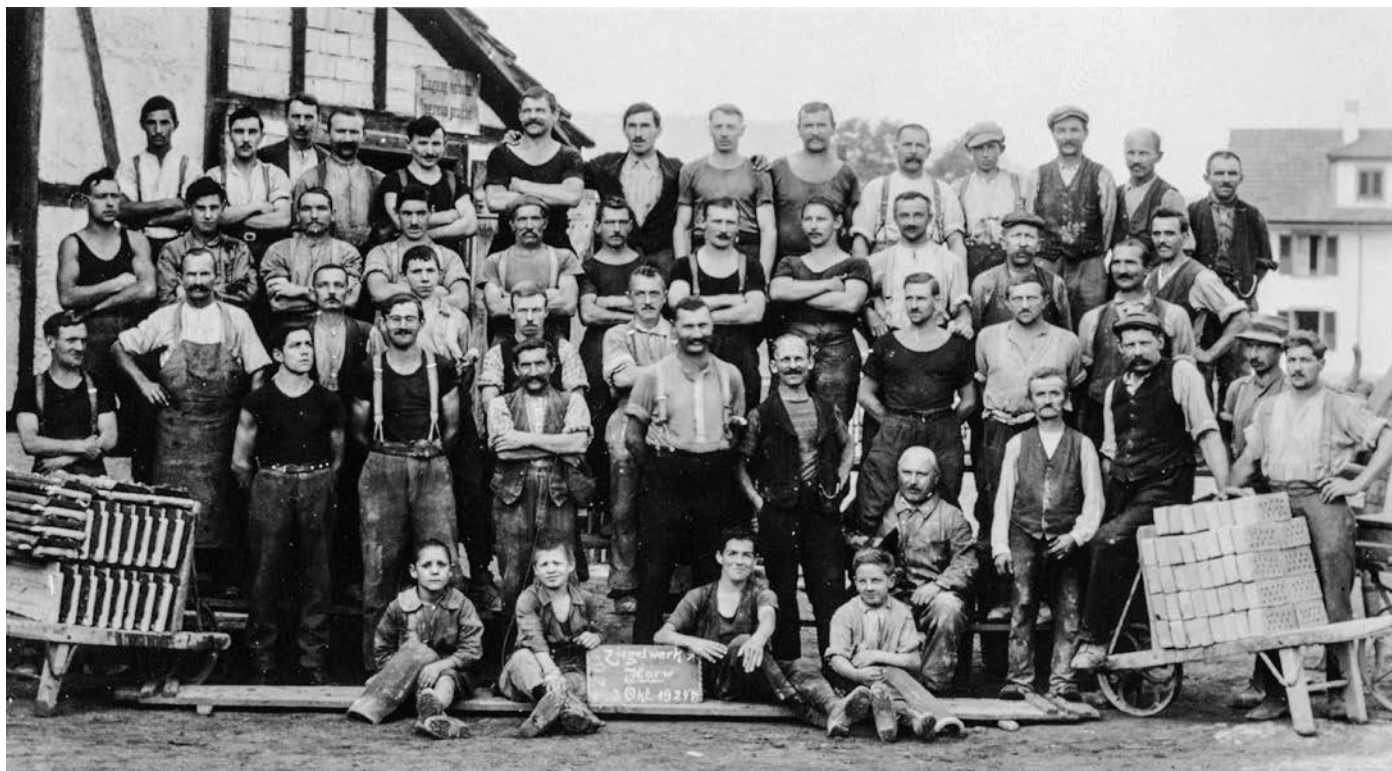
Die Belegschaft der Ziegelei Horw im Jahre 1924.